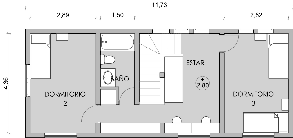
PLANTA SEGUNDO PISO 1:50